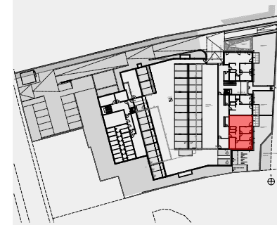
ÜBERSICHT (ohne Massstab)