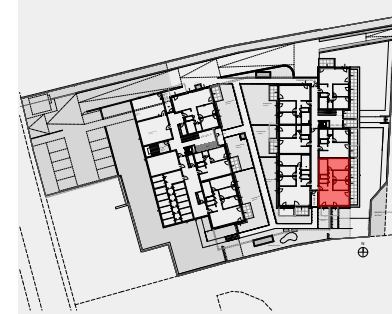
ÜBERSICHT (ohne Massstab)